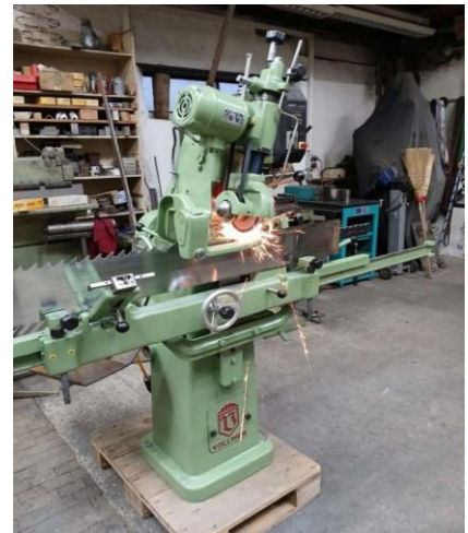
Schärfautomat VOLLMER Cne, Jg 1959