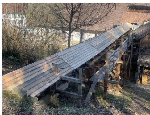
Der neue Kanal mit Dach /Witterungsschutz