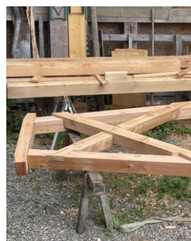
.....an Ort und Stelle abgebunden...