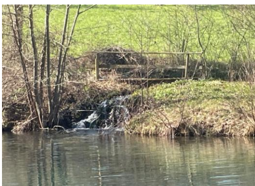
Sagiweier, Energiespeicher des Betriebs

Gemäss Wassernutzungsgesetz des Kanton Aargau (WnG, §6) bedarf die Wasserkraftnutzung einer Konzession. Das gilt auch für den mechanischen Antrieb der Wysebacher Sagi. Die bestehende Konzession ist befristet und muss 2030 erneuert werden. Der Kanton hat den Verein aufgefordert, eine Konzessionsverfahren mit Gesuch, Vernehmlassung und öffentlicher Auflage einzuleiten. Erste Gespräche haben stattgefunden. Offen ist zurzeit, ob die Wassernutzung allenfalls unter dem Titel Museumsbetrieb bewilligt werden könnte, was ohne formelle Konzession möglich wäre.