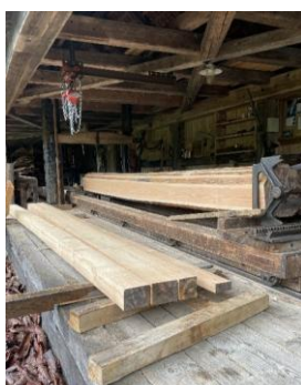
...auf unserer eigenen Sagi zu Balken und Brettern eingeschnitten...