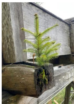
Fichte auf der morschen Holzkonstruktion, sympathisch zwar, aber ....